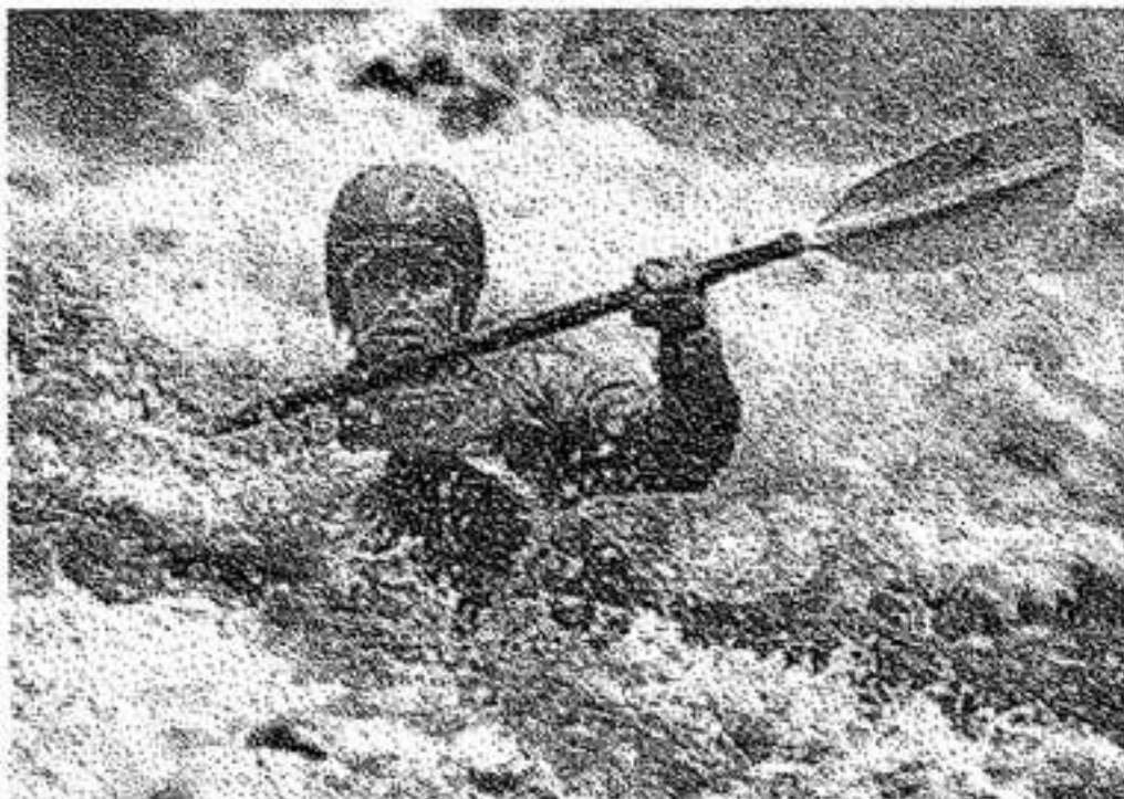
Padding jacket & pants van Patagonia

GENT - ST. AMANDSTRAAT 20 TEL. 09/223 37 92