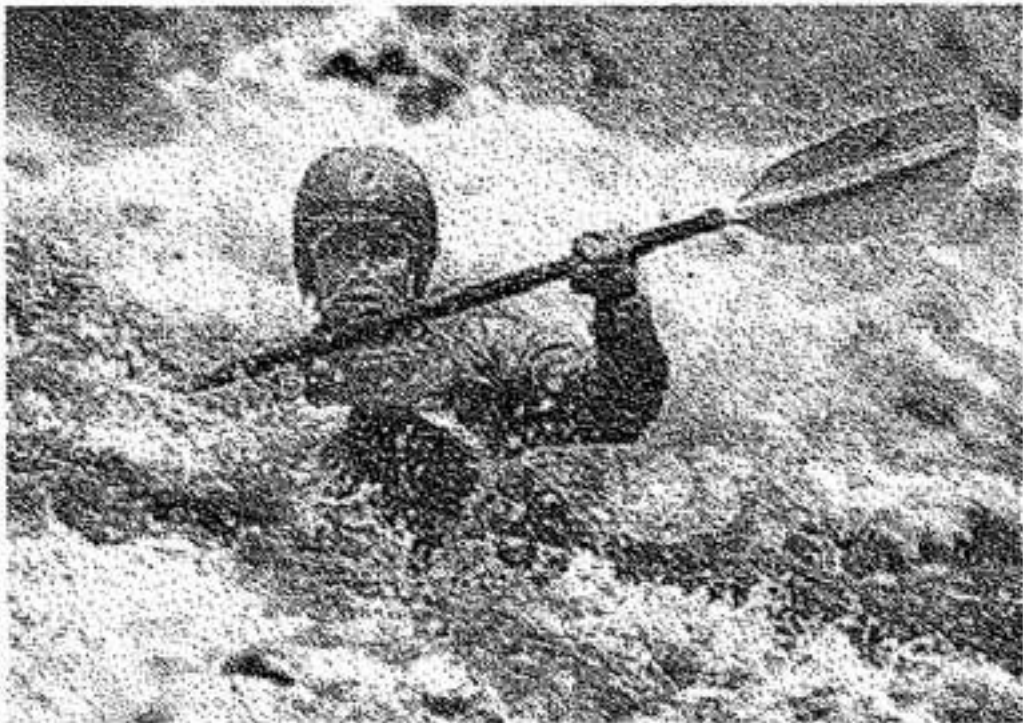
Padding jacket & pants van Patagonia

GENT - ST. AMANDSTRAAT 20 TEL. 09/223 37 92