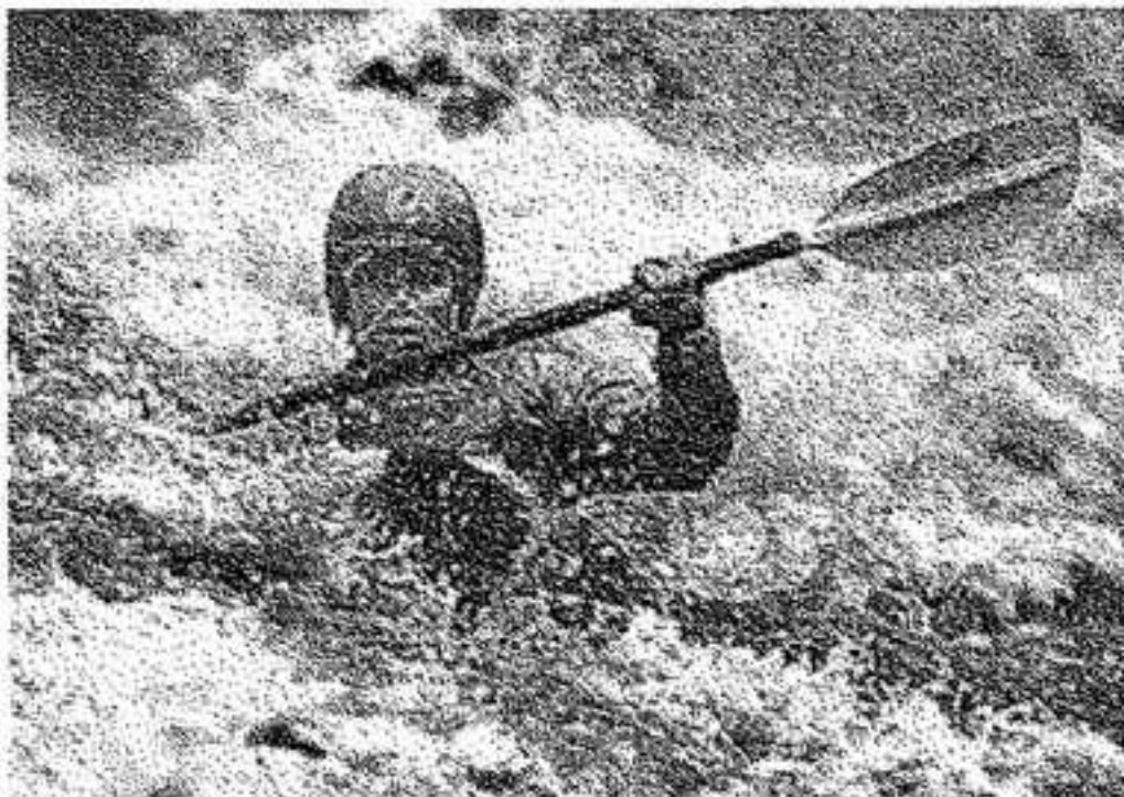
Padding jacket & pants van Patagonia

GENT - ST. AMANDSTRAAT 20 TEL. 09/223 37 92